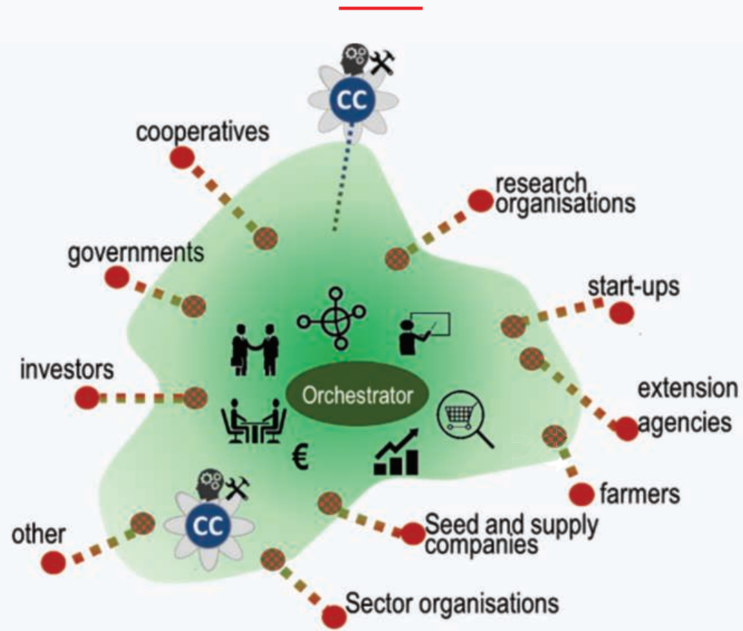
SCHÉMA SPOLUPRÁCE V SÍTI DIH